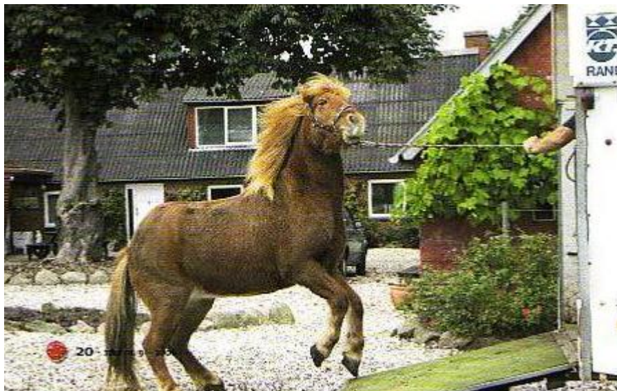
Protesterne kan godt være voldsomme!

Det er jo også i den slags tilfælde, at folk kommer til at slå deres heste eller læsse dem på en måde, som godt kan ligne vold, og det er jo ikke det, der er meningen – heller ikke selvom man måske ikke håndterer ungehestene på Island!