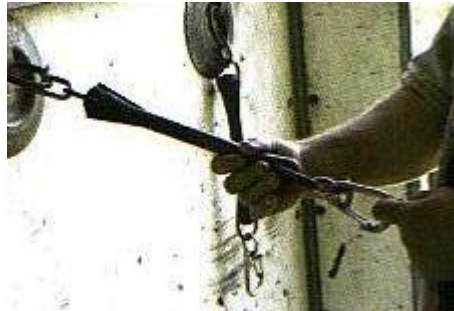
En kraftig gummistrop er den ideelle måde at binde hesten på.

Det er ikke muligt at binde en hest så stramt, at den ikke kan komme over bommen med forbenene, mener Børge, og vender igen tilbage til udgangspunktet: Hvis hesten har lært at stå bundet, så prøver den heller ikke at kravle over. Selv binder han hestene med en tyk gummistrop, som har den fordel, at den giver sig en lille smule og altså ikke giver hesten et "ryk" i nakken, hvis den forsøger at komme fri. Samtidig er der inde i gummistroppen en anordning, som gør, at hvis den springer, så springer den væk fra hesten.